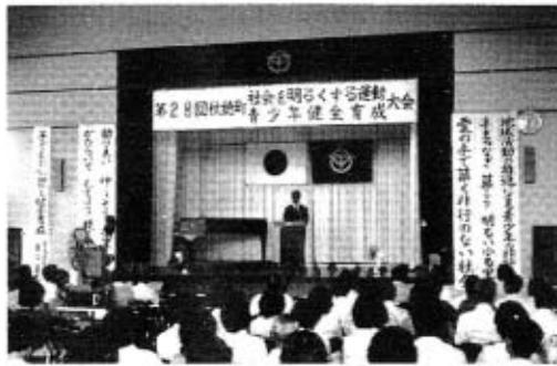
去年の第28回社明大会