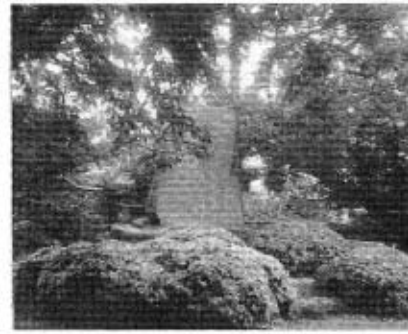
大村益次郎誕生地碑

文化財保護審議会の答申をへて、五月の定例教育委員会に提出され審議した結果、このたび、町指定文化財に、西天田にある大村益次郎誕生地碑と、天田墓地にある大村益次郎両親の墓が史跡とし