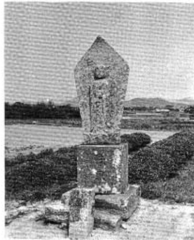
世直し祈願の地藏尊 (中野峠, 文政13年・天保元年・1830年7月建立)

元禄時代に続く宝永四年（一七〇七）八月二日には大風、一〇月四日には大地震があった。秋穂浦給領主・井原氏が、秋穂浦沖に三五町歩の塩田開作を築立中であつたため大被害をうけ、ついに築立成就できなかったことは既に述べてきた。秋穂での被害が大きかったのは、八月二日の台風が続いて起こったからであ