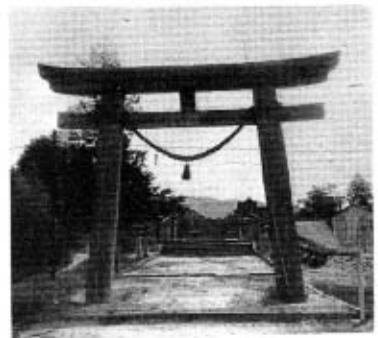
正八幡宮二ノ鳥居