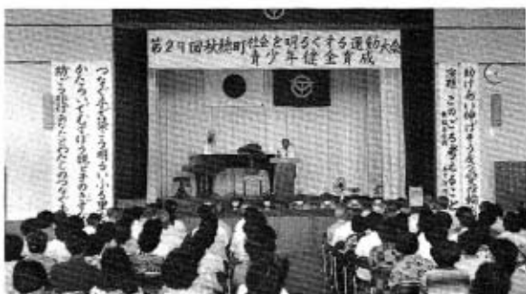
盛大に開かれた社明大会