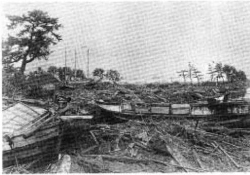
昭和17年の災害—井南入川北側付近