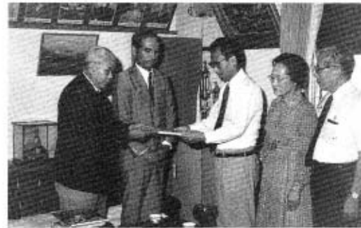
贈呈式（町長室にて）

山口中央ライオンズクラブは、昭和四十六年小郡町に創立されて以来、ライオンズ精神にもとづいて、地域社会の生活・文化・福祉に関心を示し、社会奉仕に努力しています。