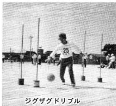
ジグザグドリブル