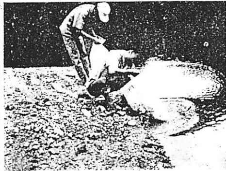
大原湖に色こい放流

在村、不在を問わず、農業者が耕作放棄地については所有制限が廃止されました。農地法改正についての解説は一応これで終わりますが、改正された農地法は、十月一日から適用されます。くわしいことやおたずねなごは、農業委員会に