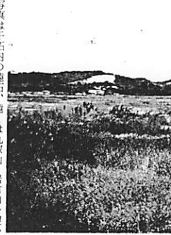
写真は千石内の遠石、遠くは丸塚山、岩倉山を望む

④町が将来どのようになってほしいと思われますか ⑤外から見た阿知須について気づき(感想、意見)