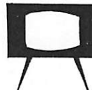
白黒テレビ 226台 (279台)