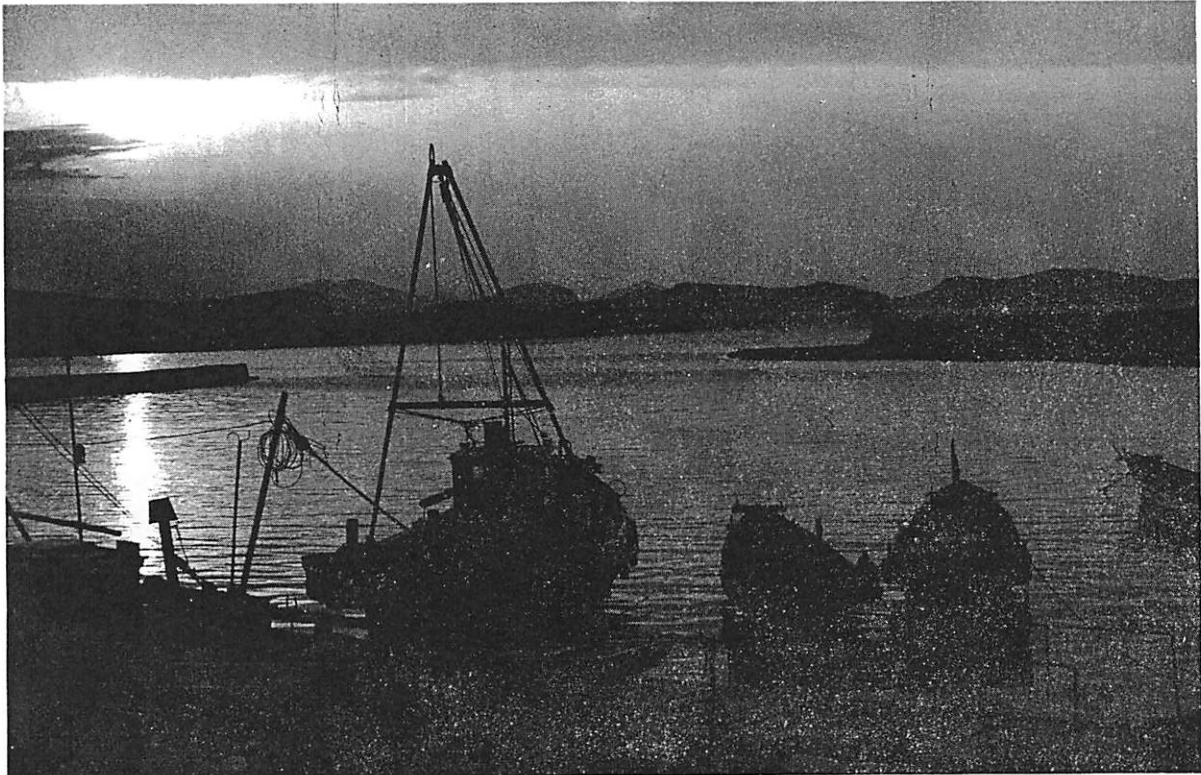
写真は平野貞夫さん(埴田北)の作品