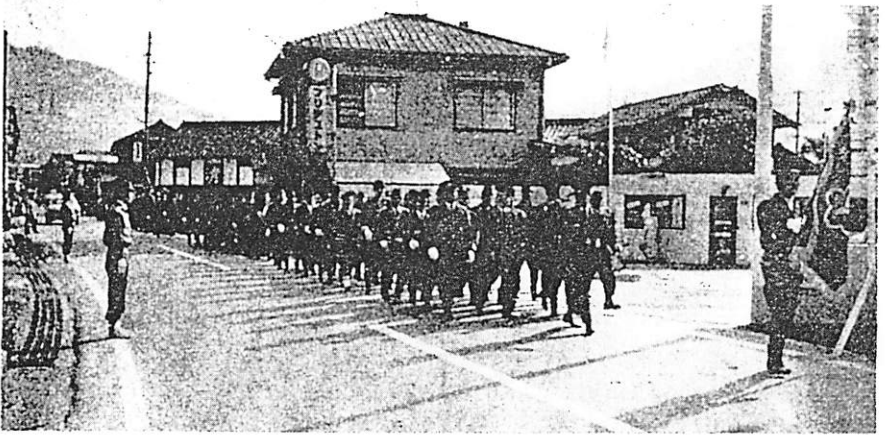
上 (消防出初式分列行進)