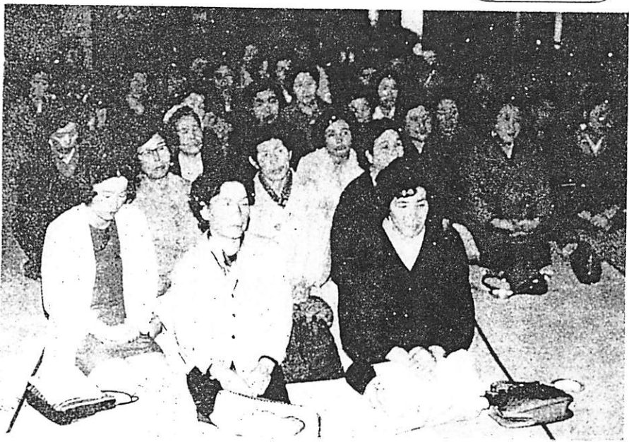
写真は、3月28日中央公民館大ホールで開催された佐波郡連合婦人会総会のひとこまでです。