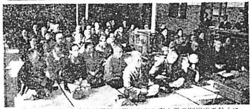
写真は、3月27日中央公民館で行なわれた寿大学の開校式で熱心に書き入る、お年寄りたちです。

薄い血は、都市の婦人だけでなく、農村婦人の健康をおびやかしめておられます。 農村婦人の貧血は、現金収入を得るためにパートタイムで働いて家に短く農作業や家事、炊事という働きのしつらかあちやん農作業の地帯に多いようです。