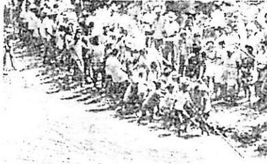
写真は雨乞い折願 八月三十日給路借取退にて