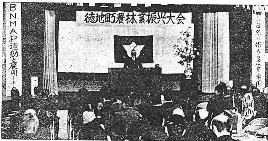
写真は農業振興大会 1/25日写す