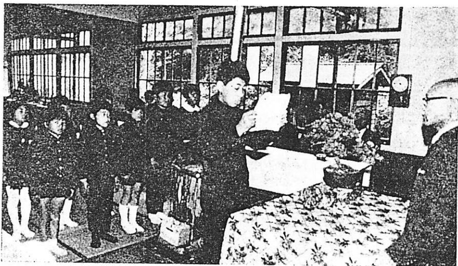
△ 离校式で感想文を読む生徒代表 3/30