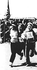
写真左上・3700人集まった開会式 上は「満員電車」でお母さんもハッスル

全町民の四割を占める参加者の入場行進で開演。おび子たちも高聲でおはあちゃん、おじいちゃんと一緒に「トリム運動」や小学生十八人、中学生五人、一般六人で編成して綱を引く「力くらべ」、「障害物走」など趣向に富んだゲームに地区対抗競走も