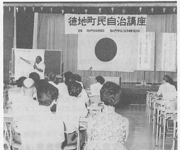
徳地町民自治講座