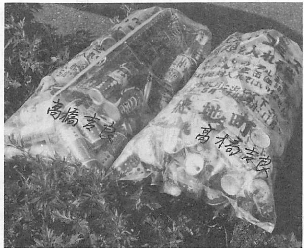
▲ ゴミは、きめられた袋に入れ 収集しやすいように荷造りをする。 …氏名も書くことを忘れずに…