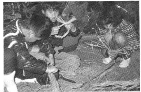
伝承教室しめなわ作り 十二月二十五日(火) 二十六日(水) 中央公民館・大海分館の二会場で伝承グループのかたがたからしめなわ作りの講習を受けました。