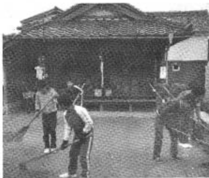
東天田子ども会清掃活動 十二月二十四日(月) 八十八か所、十番札所・福楽寺の清掃に取り組みよい子たち。