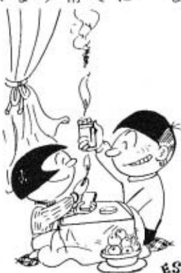
子どもの火遊びにご注意

特に、いたずら盛りの幼い子どもがいる家庭では、「火遊び」にも十分注意してください。