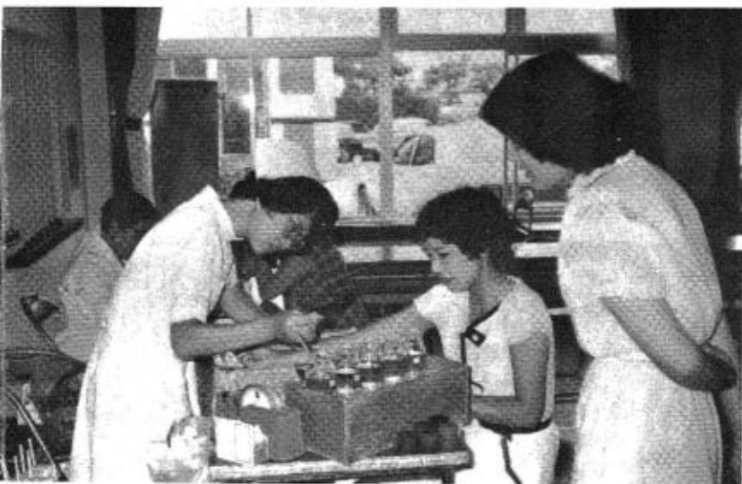
自分たちが企画した20歳の献血をする成人者