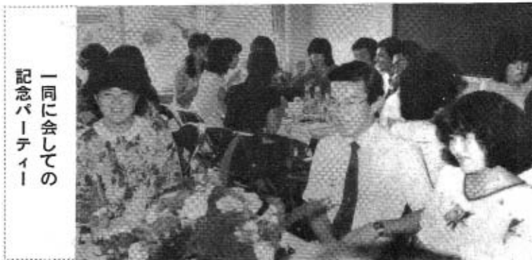
一同に会しての記念パーティー