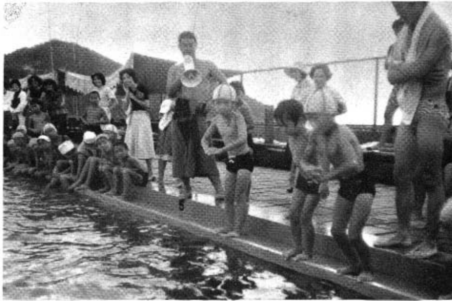
それ、飛び込め こわくない

程度が考えられ、浮き身からクロール、平泳ぎなどの基本泳法をみっちり教わりました。