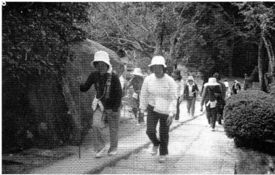
つかれたな～岩屋山はまだかな

稲穂の黄金色もあざやかに秋色の一段と増した十月五日第三回目の八十八か所巡りを行いました。体力の向上と、郷土秋穂の恵まれた美しい環境を再認識し、郷土