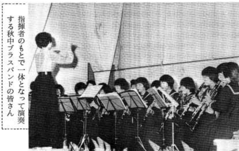
指揮者のもとで一体となって演奏する秋中プラスバンドの皆さん