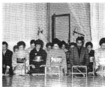
謡曲教室の皆さん