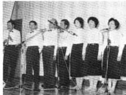
詩吟教室の皆さん