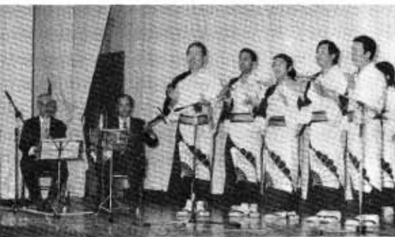
民謡教室の皆さん