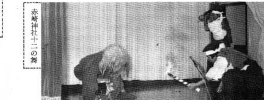
赤崎神社十二の舞