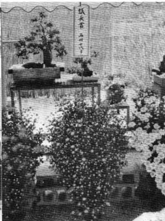
恵まれない天候にめげず、こんなにすばらしい菊ができました。園芸クラブ