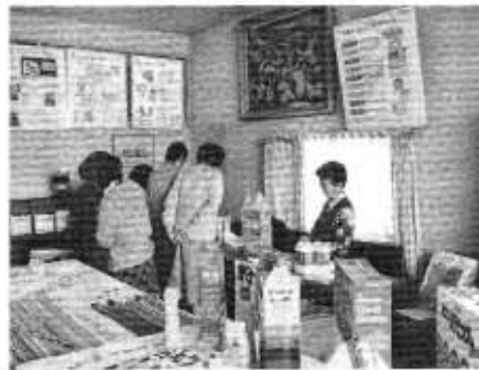
賢い選択, 消費者学級