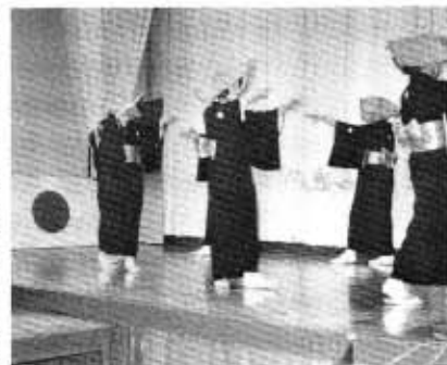
民謡同好会の皆さん