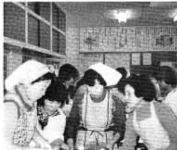
バザーのごちそうをつくる栄養大学の皆さん