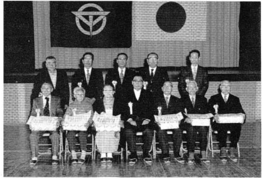
喜びの受賞者の皆さん