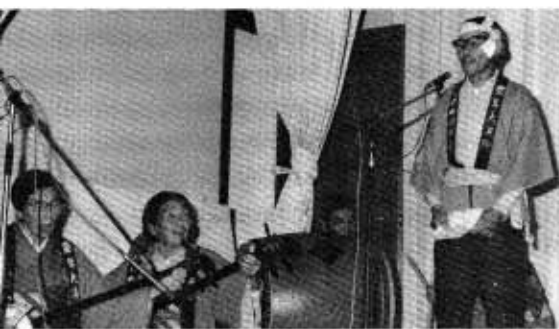
大海豊年大漁踊り