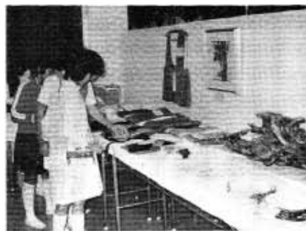
老人クラブの作品展