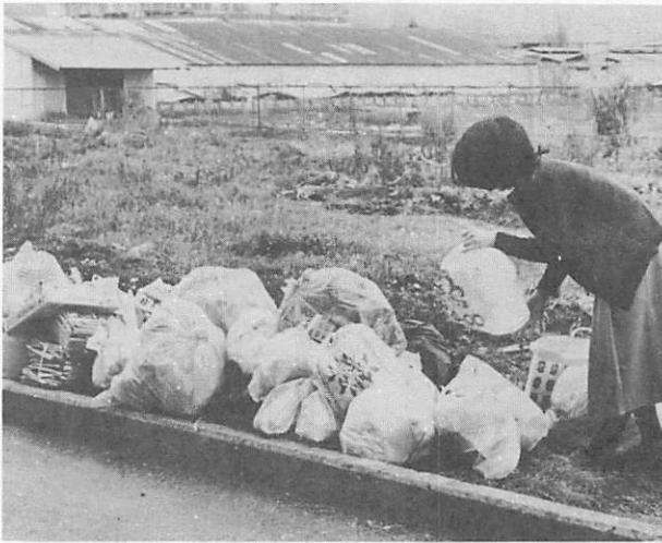
燃えるごみは、種類ごとにわけて、写真のように持ち運びが便利な大きさにしっかりとくくることが大切です。(吉敷で)