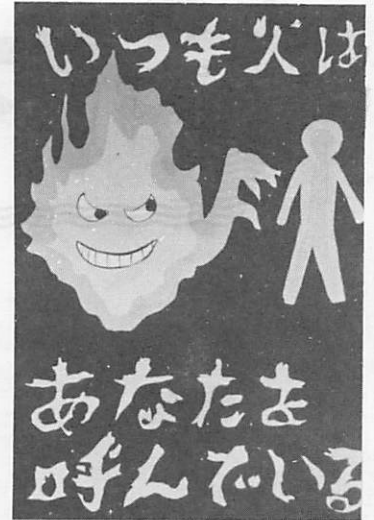
防火を呼びかける児童のポスター