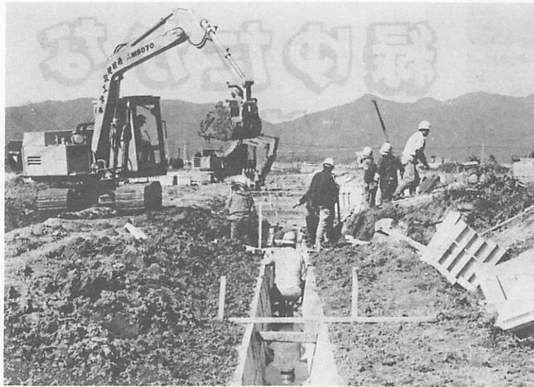
近代的な農業経営を進めるためにも農地整備が必要です。農地の用排水工事が進む名田島新開作。

近代的農業が可能な農地をめざして、昨年度から進めております新構造改善事業の名田島、仁保一貫野のほ場整備のほか、多目的研修集会所施設を同じ一貫野に建設します。転作促進対策事業では大豆の脱粒機、イチゴのハウス施設の整備を図り、山村振興事業とし