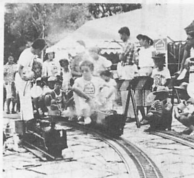
どンドン催しに参加してみんなで盛りあげましょう(昨年のミニ・SL)

郵便局では、身体障害者福祉強調運動にちなみ、四月二十一日からはがき左上部の切手相当部分に「青い鳥」を配した二十円はがきを発売します。 重度の身体障害者(一・二級)で、満六歳以上の人の申し出によって、一人二十枚を無料でさ