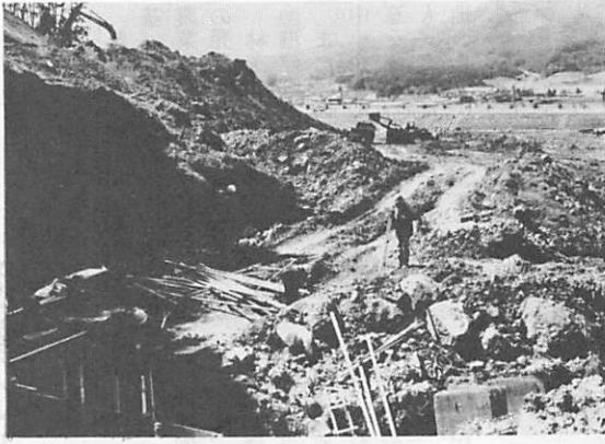
県中部環境施設組合が、平川と小郡町境に進めている、し尿処理場造成工事。来年の十月には完成します。