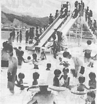
昨年8月17日オープン以来多くの市民でにぎわった市民プール