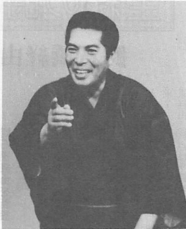
高座で熱演中の三遊亭内楽師匠