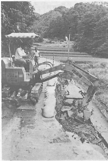
降り続いた長雨で、路肩が決壊した市道長谷線

十月一日、全国いっせいに国勢調査が行われます。調査の対象は、国内に住んでいる人々です。長期滞在者や赤ちゃんも含まれますので、注意してください。調査票に記入していただいた内容をほかにもらしたり、統計以外の目的に使うことは法律で固く禁止されています。国勢調査は、より明るく、より豊かな町づくりへの第一歩です。積極的にご協力ください。