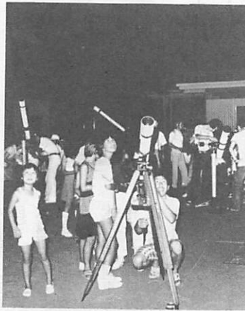
今年7月の巡回天文教室。宇宙に夢をと多くの市民でにぎわいました

◆天文教室 日時 十一月一日・八日・十日 市児童文化センター主催の天文教室と楽焼講座の受講者を次のとおり募集します。両講座とも申し込みは同センター(電話二一四二八五)。定員になり次第締め切ります。 ◆楽焼講座 日時 十一月九日、十二月七日 時間はいずれも午前九時三十分から二時