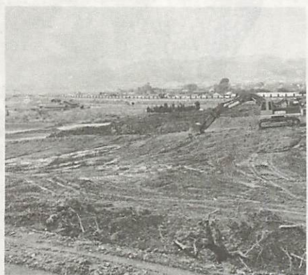
造成工事がほとんど終わり、間もなく施設の整備にかかる南部運動広場用地

南部地区の皆さんにご利用いただくために、嘉川清水が丘(雨乞山西ろく)に、三月末完成を目途に建設が進められている南部運動広場の造成がほとんど終わり、間もなく施設の整備にかかります。建設地は、国道二号線(小郡バイパス)と山口県中部環境施設組合が建設を進めている斎場との間、約一万六千平方メートルの丘