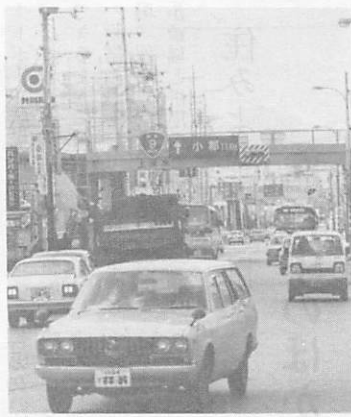
冬は凍結や降雪などによって路面の状況が変わります。安全運転「5原則」を守って運転しましょう