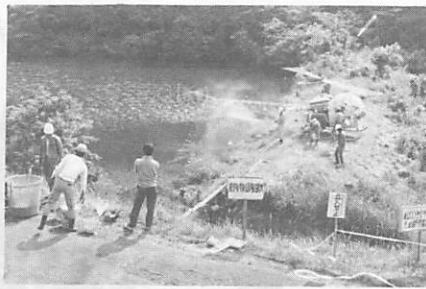
ヘリコプターに薬剤を積み込んで空中防除へ(昨年)

雨量が多かったために、昭和五十四年に比べると被害面積で二十割、量で十六割減少しているものの、十一月末からは再び被害が増える傾向にあります。