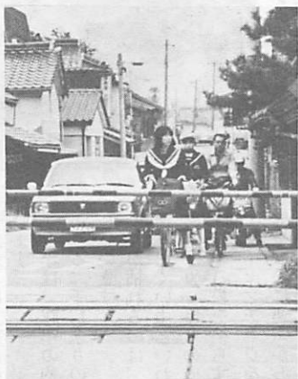
昨年、県下での踏切事故は67件発生し、12人が亡くなりました。踏切事故のないよう互いに注意しましょう

国鉄では、五月二十一日から六月十日までの間、全国的に「線路にはいらない運動」と題して、列車事故をなくす運動を実施します。 国鉄の安全輸送のため、特に次の事項を守るようご協力ください。 ■踏切では、人も車も必ず止まって安全を確かめましょう。