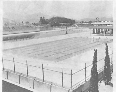
このほど完成した、25メートルプール。夏の利用に大きな期待が寄せられています

られる市民の利便を考え、自転車置き場と大型車四十台、普通車百四十台が収容できる駐車場を備えたものです。これらの施設の完成で全施設が整いました。既に完成して