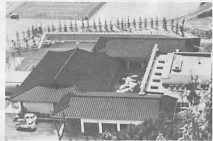
四十台収容できる駐車場を備え、無煙、無臭、無煙突のスマートな齋場「浄明苑」

建設を進めていた齋場「浄明苑」が完成し、六月二十日に落成式を挙行、同日午後から使用を開始します。