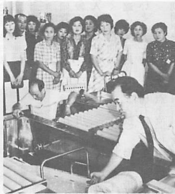
研修で梅光園の施設を見学する、宮野地区水曜学校の皆さん(55年7月)

市俳句協会では、九月十二日午後一時から県神社会館で行う第三回市民俳句大会の作品を次により募集しています。 ・作品 二句(夏季雑詠で未発表のものに限る) ・応募方法 七月二十日までに、はがきか投用紙で、市中央公民館(中央二丁目五一)へ資格 市民が市内に勤務している人及び市俳句協会加入者