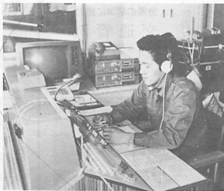
緊急出動の連絡に備えて、通信指令室で緊張して待機する消防署員

緊急電話のベルが、リリリンと鳴りひびく。「はい、こちらは二一九、消防署です。火事ですか、救急車ですか。場所はどこですか。付近に何か目標がありますか」これは消防署一階にある通信指令室の署員の声です。消防署では、昼夜の別なく、いつ起るか分からない火災や救急事故などの出動に備えて毎日緊張の連続です。 消防の組織には、本部と署の二つがあり、署には本署と南部地区を担当する名田島の南出張所があります。 消防署の主な仕事は、火災の警戒をはじめ、消火活動、救急業務など第一線の現場で活動する部隊です。 本署は、署長以下三十七人で、署長を除いた三十六人を第一小隊と第二小隊の二隊に分け、十八人が交替で二十四時間の勤務に就きます。 消防車両は、水槽付消防ポンプ自動車一台、普通消防ポンプ自動車二台をはじめ、二ノメートル級はしご自動車、化学ポンプ車、林野火災工作 車など各一台と夜間の消火活動に一段と威力を発揮する照明工作車などを合せて七台が配備されているほか、救急自動車三台が緊急事態に備えて、いつでも出動できる態勢を整えています。 火災出動は、昨年は一年間で四十四回出動しました。 救急業務では、毎年二千回以上も出動しており、一番多いの