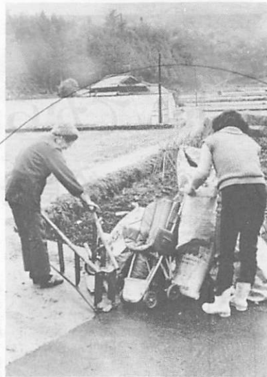
空びんやガレキなどを出すときは、散乱しないよう荷作りして、収集日の当日朝8時30分までに出示しましょう