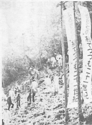
昨年4月、「21世紀の森」建設予定地(天花畑)で行われた、山口県植樹祭の様

緑で、健康な住みよい郷土をつくるために、今年も三月一日から四月十日まで春季国土緑化推進運動が全国でいっせいに展開されます。 市緑化推進協議会では、今年度も、この期間中に緑の羽根を各戸に配布し、緑化思想の高揚をはかるとともに緑化募金をお願いいたします。 今年度の募金目標は、五十万円です。