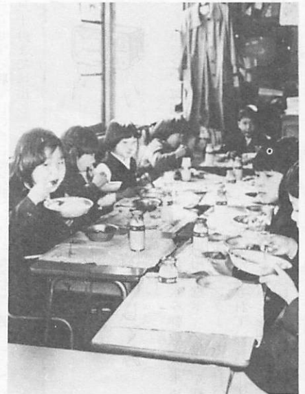
待ち遠しいごはん給食。班ごとに別れて、楽しい雰囲気です。

給食のおばさんが、朝早くから夕方までがんばって作ってくださるので、おいしい給食が食