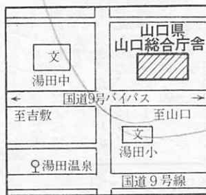
県山口総合庁舎位置図

5事務所、新庁舎に移転 神田町の旧山口職業訓練校跡地に建設が進められていた山口県山口総合庁舎(鉄筋3階建)が、このほど完成しました。 この完成に伴い、三月二十七日から三十一日にかけて、次の日程により各事務所の移転が行われます。 山口県税事務所(電二五一一一) 三月二十七日に移転し、二十九日から新庁舎で 山口土木事務所(電二一〇七〇) 三月三十日と三十一日 中部社会福祉事務所(電二二二二三七) 三月二十九日に移転し、三十日から新庁舎で業務を行います。 山口土地改良事務所(電二二一九九三) 三月二十九日に移転し、三十日から新庁舎で業務を行います。 山口農業改良普及所(電二二五二四九) 三月三十日に移転し、三十一日から新庁舎で業務を行います。