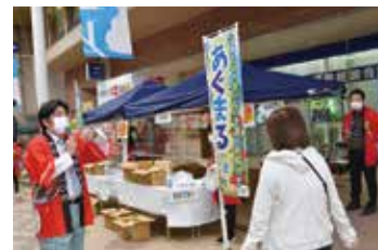
▲あぐまるやまぐち第1回目の様子