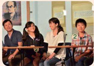
▲鑄銭司郷土館にて