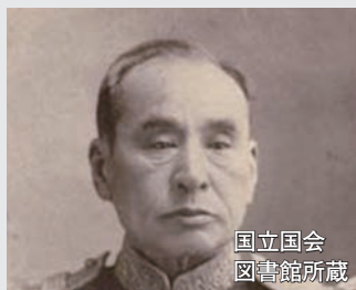
国立国会 図書館所蔵