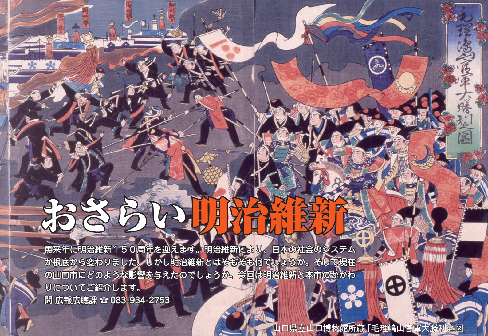
毛理嶋山官軍大勝利之図