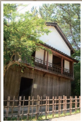
ちんりゅうてい 枕流亭

1867年、薩長連合の協議のため、薩摩藩の西郷隆盛、大久保利通らがここを訪れ、長州藩の木戸孝允らとこの二階で会見をした。道場門前と西門前をつなぐ安部橋付近にあった枕流亭。現在は香山公園内に移築されている。