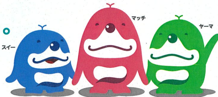
山口市移住・定住キャラクター 移獣スムスム