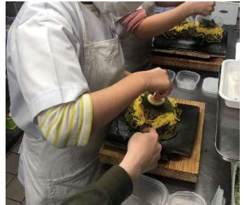
作業風景（盛り付け）