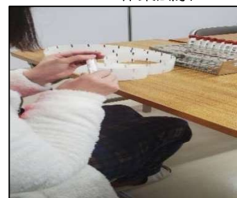
山口総合健診センターの作業風景

山口総合健診センターから委託した郵便物の封入・封緘や問診票の作成、海外向けの荷物梱包・発送などの内職作業 山口総合健診センター事務所内の清掃、センター敷地内の除草・清掃などの外作業 タブレットを用いたInstagramの管理 ビーズマスクストラップ作成などの自主製品作成など 本人の希望に沿って作業を担当して頂いております。