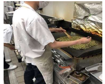
作業風景（そば焼き）

レストラン業務、ホール・厨房 工場（ごぼうコロック製造） 役務作業（封入封かん。ポケットティッシュ広告入れ、清掃）