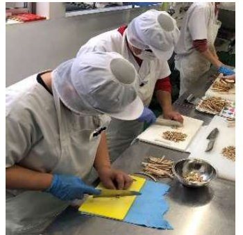
作業風景（ごぼうカット）