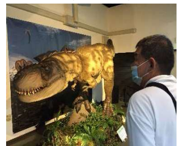
レクリエーション活動 (山口県立山口博物館)

本人の無理のない範囲で決められます。状況を見て相談しながら利用時間や日数など減らしたり増やしたりします。