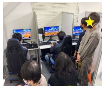
事業所内eスポーツ大会

軽作業（折込、仕分け、ラベル貼りなど） 小麦粉袋詰め ポスティング 雑貨製作 施設外での軽作業 草刈り、草取り、畑作業 eスポーツ動画撮影、動画編集