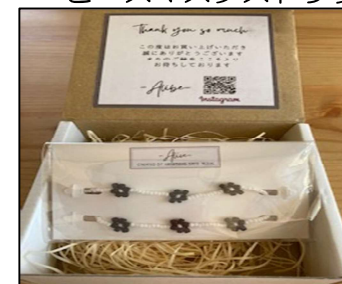
ビーズマスクストラップ