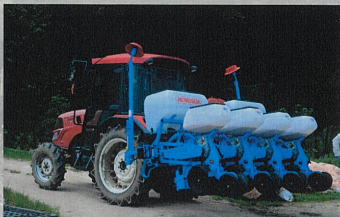
播種機 (MONOSEM N PLUS4)