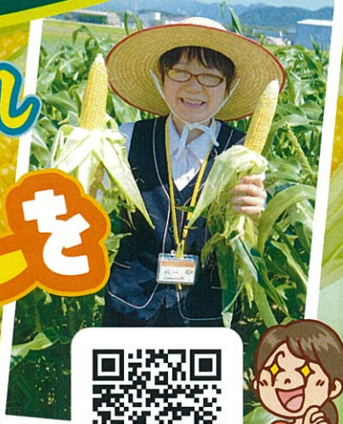
※写真はイメージです ※おひとり様1本限り