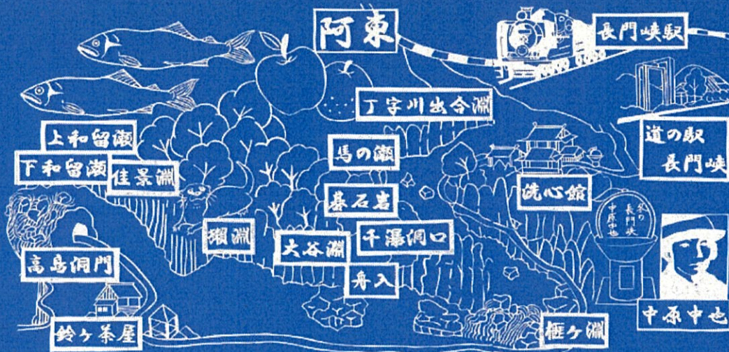
Illustration by Taketomo Miki