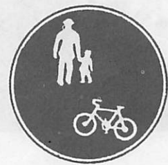
自転車歩道通行可の標識