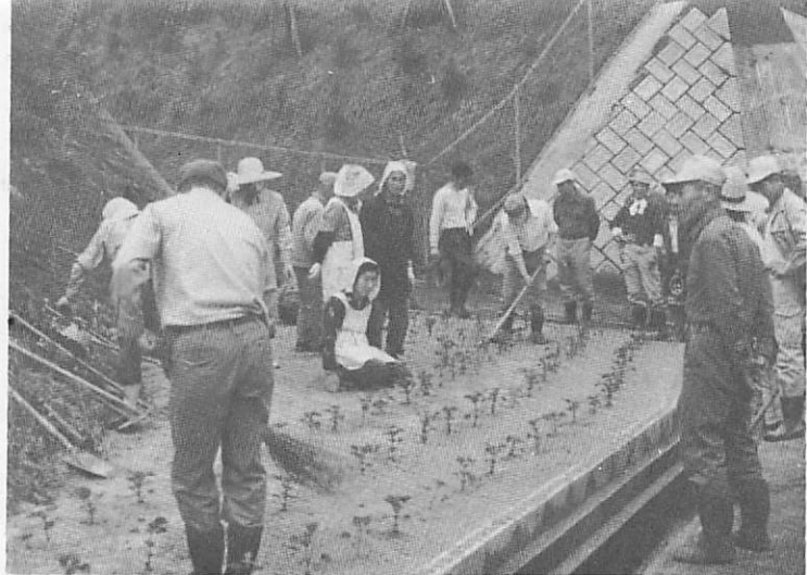
▲花壇づくりをする小古祖自治会のみなさん