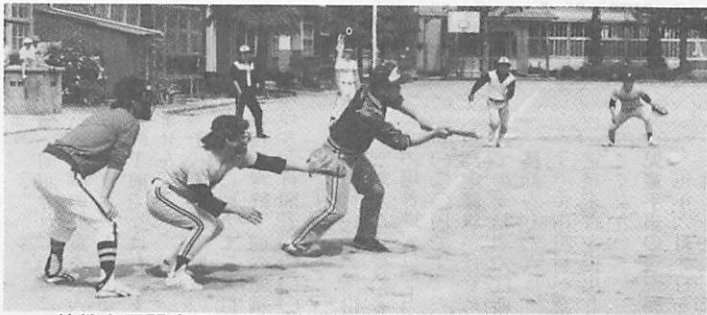
▲熱戦を展開するソフトボール大会 (八坂中で)