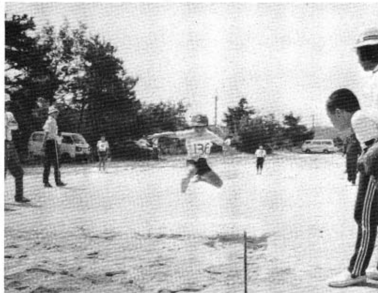
たくましい秋穂っ子の走り幅跳

陸上競技の普及と、スポーツ精神の高揚を図ることを目的に、六月六日(日)午前九時から秋穂中学校グラウンドで、第三回町民陸上競技大会を実施しました。 中学生を中心に、小学生、一般のかたがた百九十人の参加があり記録へ挑戦しました。 快晴微風の絶好の大会日和に恵まれ、中学生の部と一般の部で大