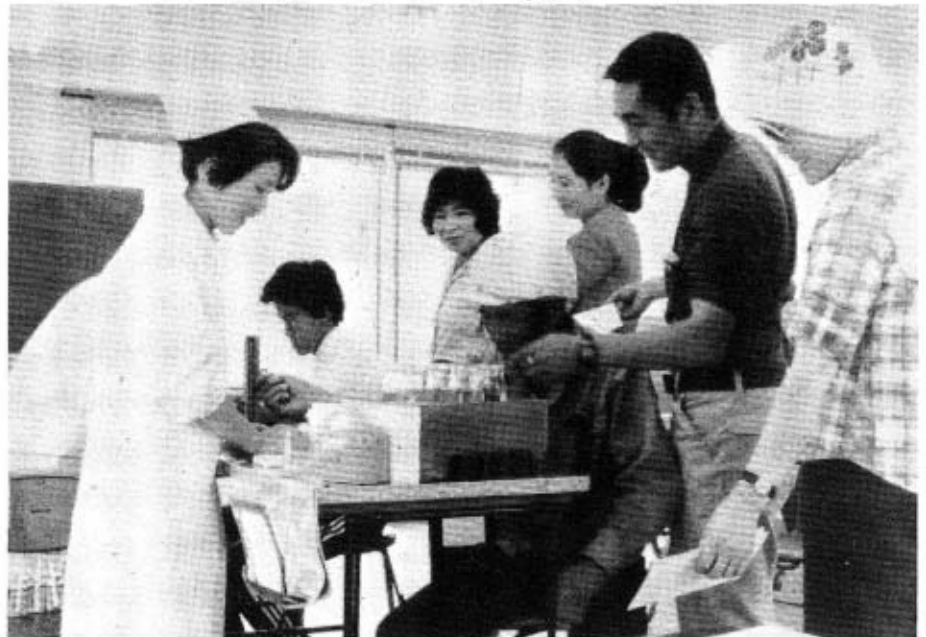
献血をする皆さん

五月二十四日の献血には、ご多用中にもかかわらず多くのかたがたのご協力をいただき、ありがとうございます。今後も献血運動に対して、よりいっそうのご理解とご協力をお願いいたします。