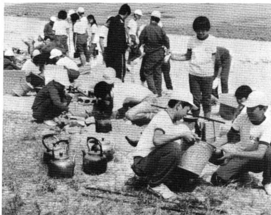
食事の準備を始めるぞ

として、六月八日、九日の両日、一泊二日の日程で、中央公民館と中道海岸を会場に秋中一年生の共同生活学習が実施されました。そのすばらしい体験学習を、作文で紹介しましょう。