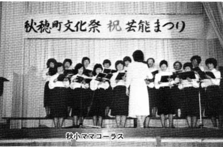
秋小ママコーラス