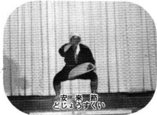
安来節 どじょうすくい