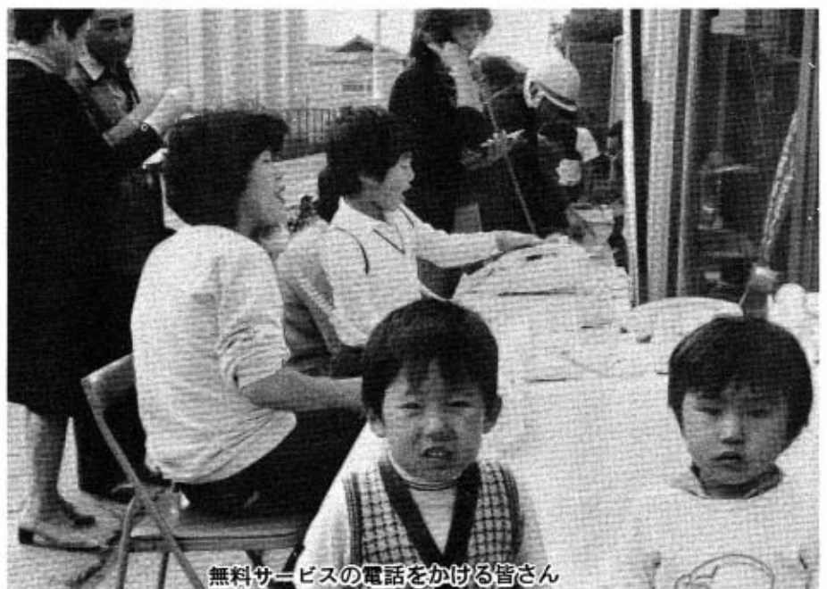
無料サービスの電話をかける皆さん

秋穂郵便局では、十一月六日、七日の二日間、町主催の文化祭に初めての取り組みとして、小郡電報電話局と協賛し次のような内容の郵便祭り行事を行いました。 皆さん、多数おいでいただきありがとうございました。 また、局では「これからも地域行事に積極的に参加し皆さんとともに町発展に寄与したい」としていました。