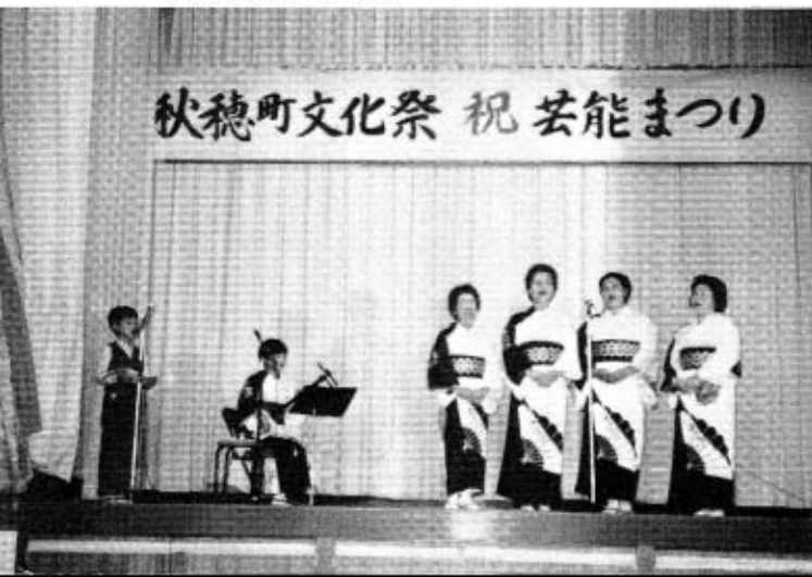
▼民謡教室の皆さん