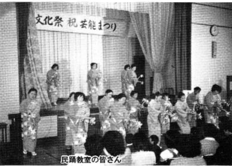
民謡教室の皆さん