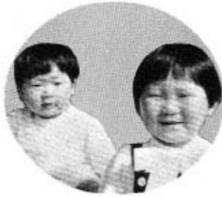
下村・田中茂穂さんの