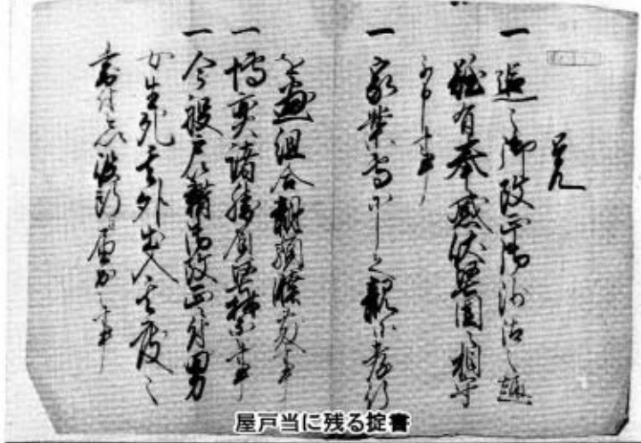
屋戸当に残る掟書