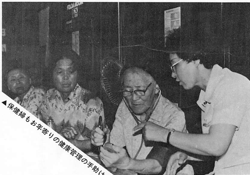
▲保健婦もお年寄りの健康管理の手助け