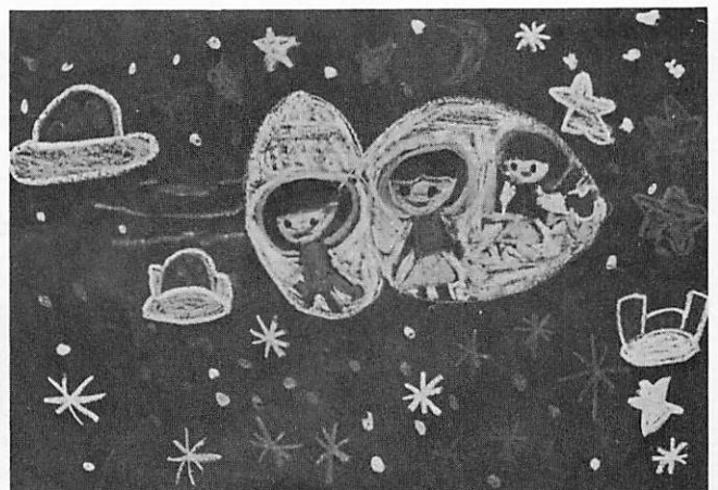
「うちゅうりょこう」