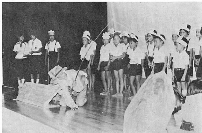
▶練習の成果はいかに

各地区の子どもたちが寸劇や舞踊など夏休みの練習の成果を披露して見学者のおとうさん、おかあさんから拍手を受けました。