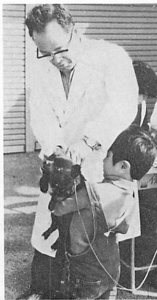
▲ペットを大事にしよう

三万一千五百六十頭。本町は百五十五頭でした。これらのほとんどは、鳴き声がつるさい、大きくなったら乱暴になった、などの理由で飼い主から手放された犬たちです。犬を手放す理由にはやむを得ない事情などもありますが、一度飼ったら最後まで飼い主の責任を全うしたいものです。保健所が犬の引き取りを行うのは、捨て犬が野犬となり人に危害を加える恐れがあるため、その防止を図ってのことです。犬の引き取りが本来の目的ではありません。引き取ってもらえるからといって、安易な気持ちで手放すのは止めましょう。