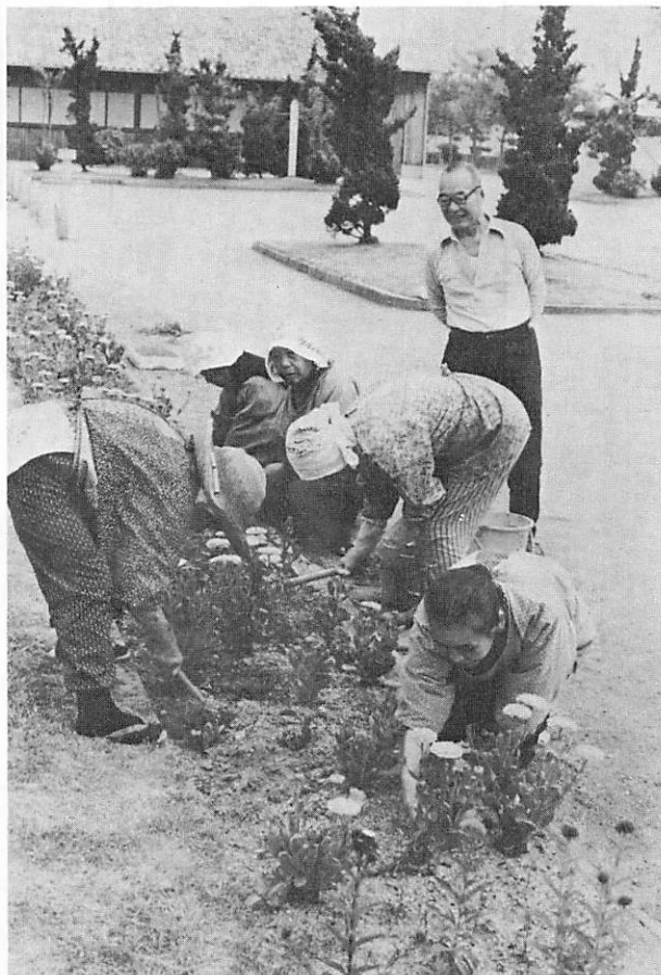
▲老人クラブは花だんづくり