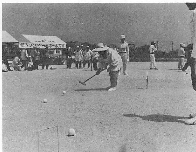
▲ゲートボールでハッスル