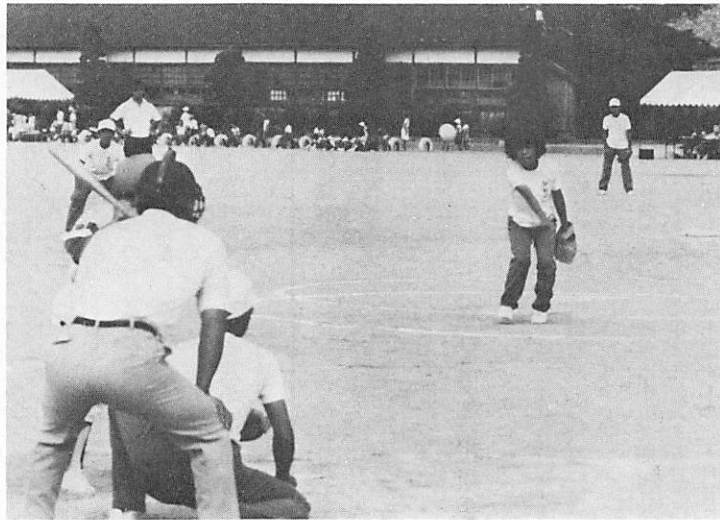
▲ピッチャー投げました……

回子ども会ソフトボール大会は 十五チームが参加、炎天下で選 手も応援団も熱戦を展開した結 果、砂郷が優勝。二位は引野、 三位飛沖でした。