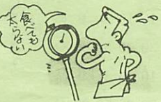
▷体重が減り、やせてくる。食べても太らない