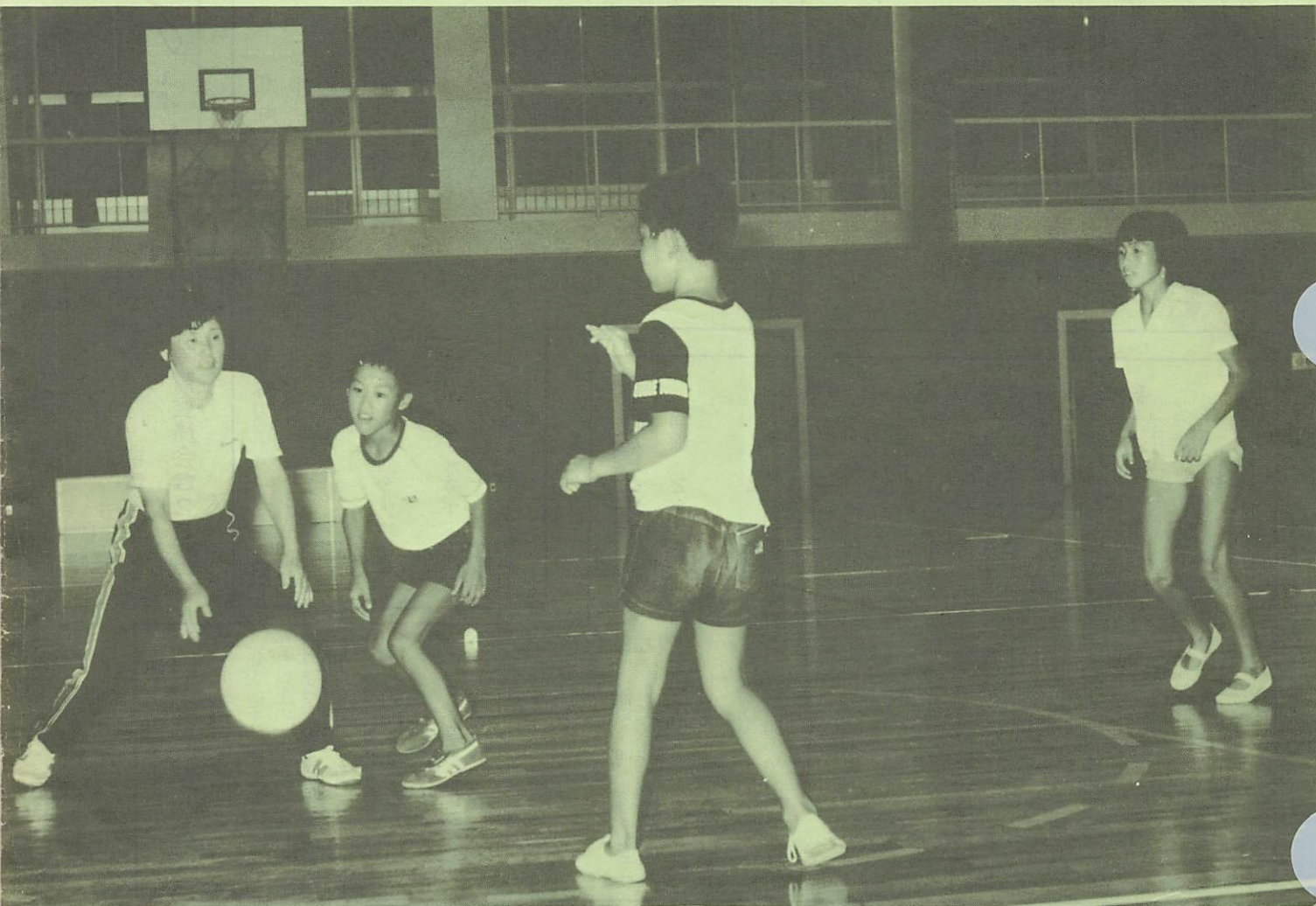
スポーツ少年団体力テスト結果 (11~12歳)