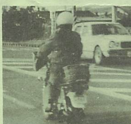
▲ヘルメットの着用を

りは二輪車と車か、車同士の事故です。原因は、酒によるものが四件もあります。これは飲酒運転のほかに酔った歩行者が事故に遭ったものも含まれています。全体的に交通道徳、交通規則をきちんと守っていれば、未然に防げたのではないかと思える事故が多いようです。基本的なきまわりはきちんと守って欲しいです。