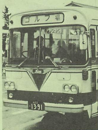
姿を消す市営バス 線からゴルフ場

町営バスは、乗客の少ないのを覚悟で走ることになります。運賃と運行経費の収支が釣り合わないのは初めから想定されま