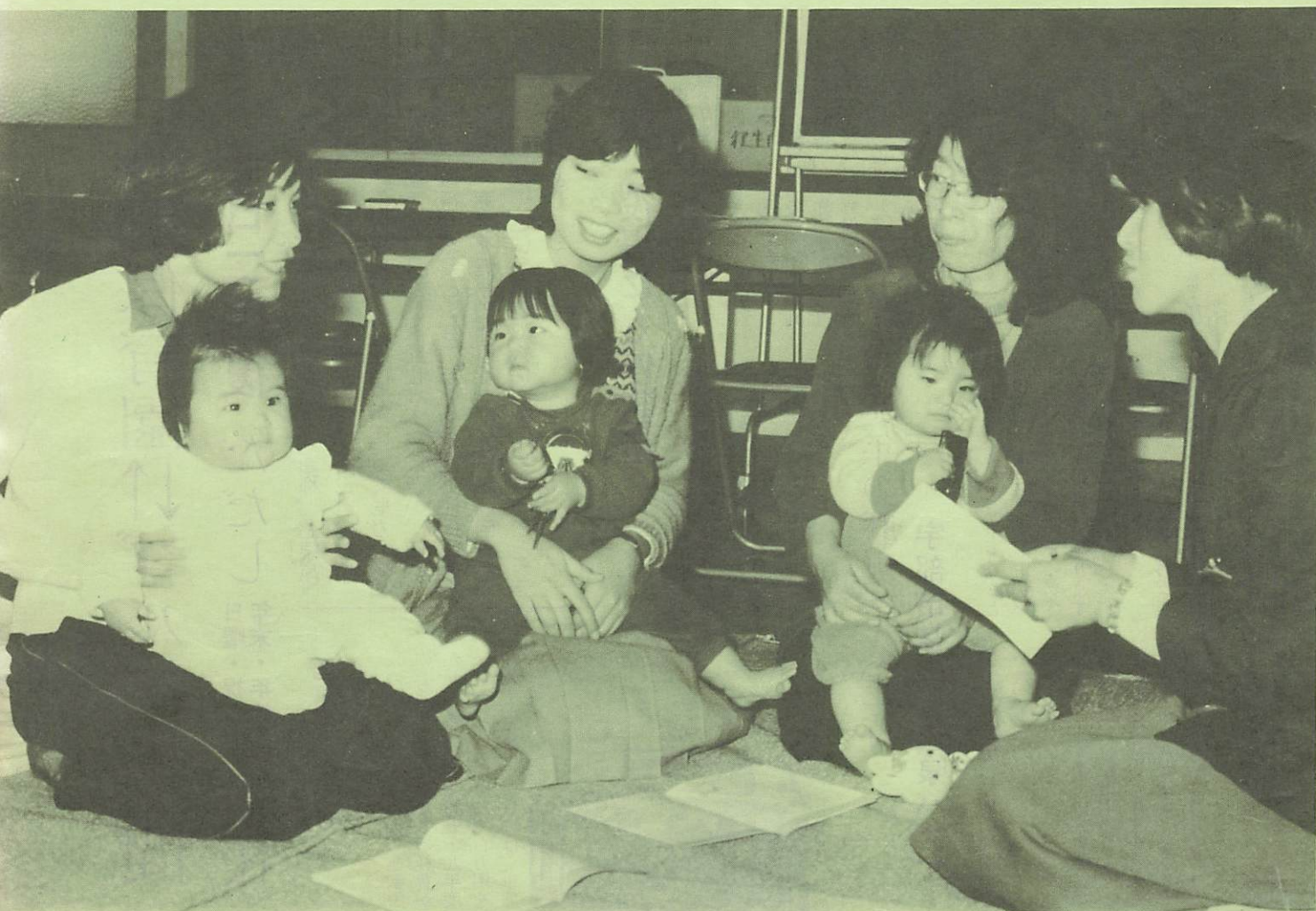
保健婦の指導を受けるお母さん