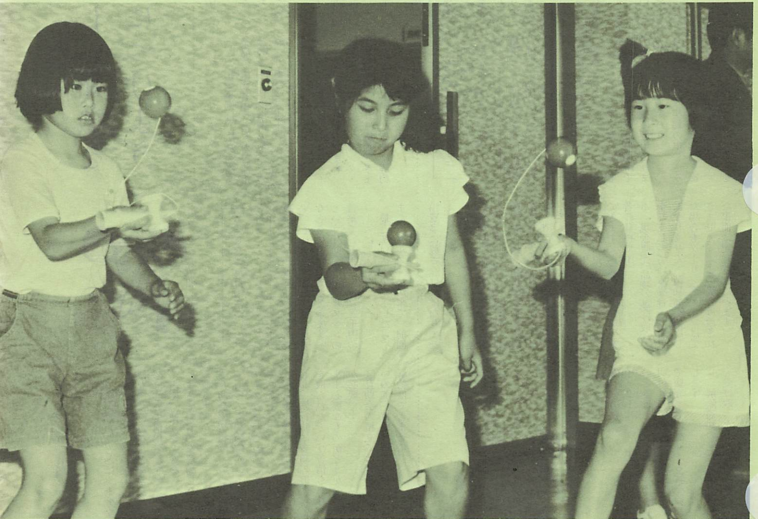
真剣にケン玉の練習をする子どもたち