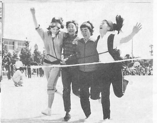
ソレ引け!! ヨイショ!!