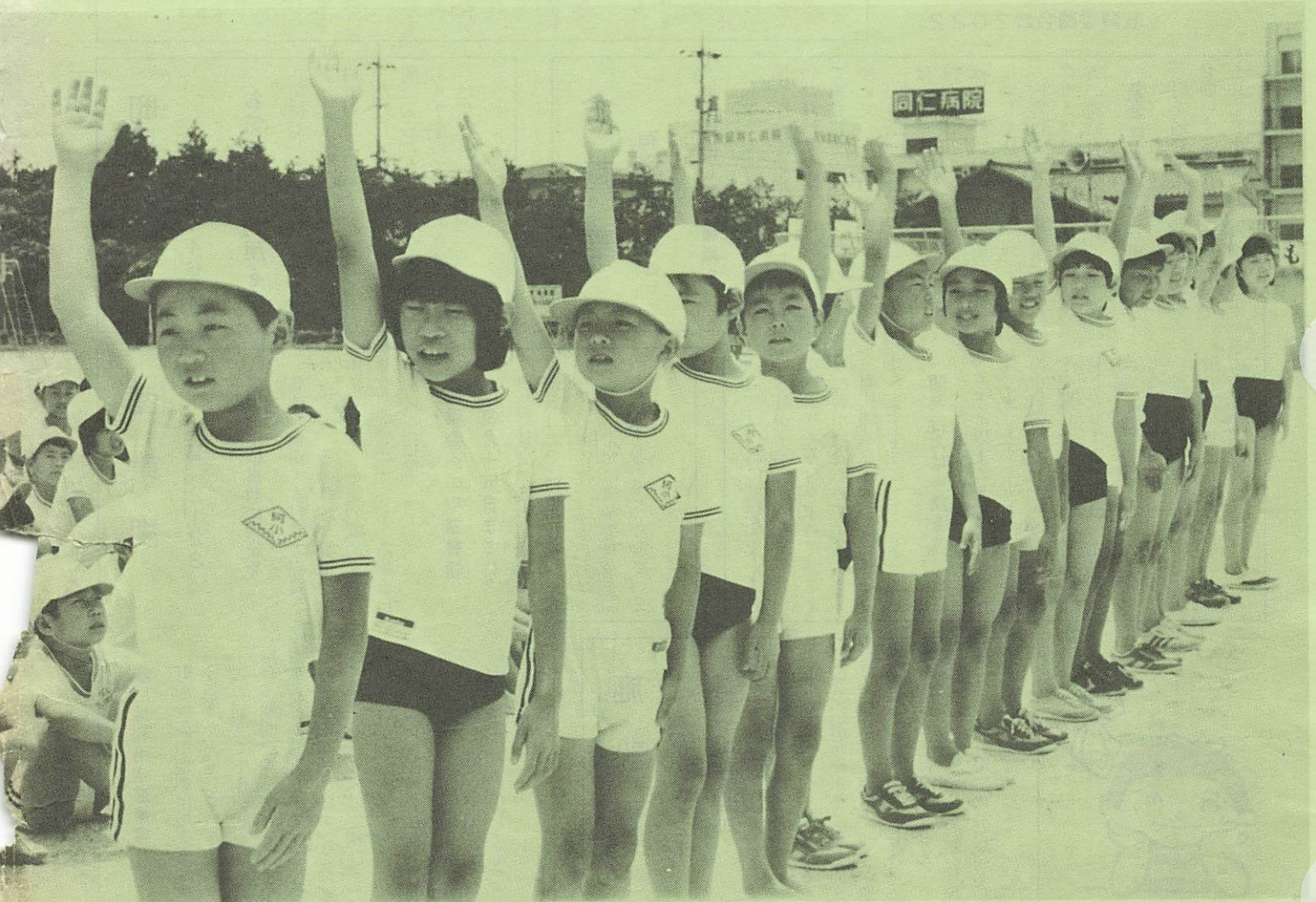
手をあげて左右を確認(阿知須小で)