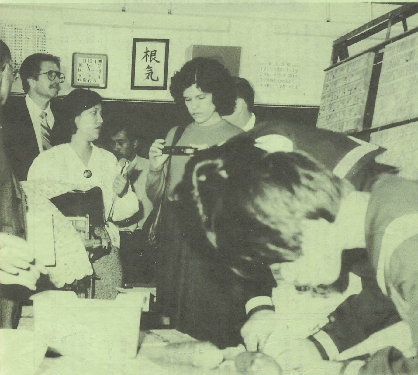
家庭科実習を参観の米国の先生（中学校で）

広報あじす 毎月5日 発行 お知らせ版 毎月20日 発行 山口県吉敷郡阿知須町 発行 阿知須町役場 電話 4111番(代) ☎754-12 印刷 よしの印刷株式会社