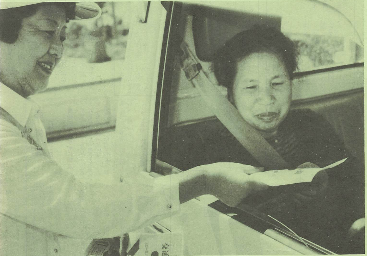
シートベルトの着用を呼びかける婦人会の役員