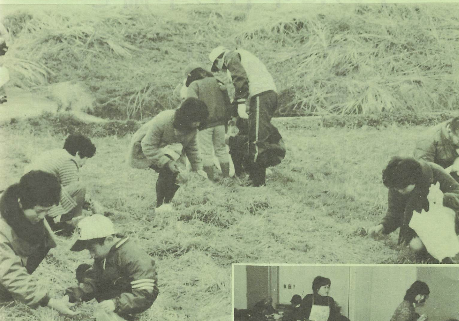
▲「これがホトケノザよ」 ▶「七草がゆ」を味わいながら