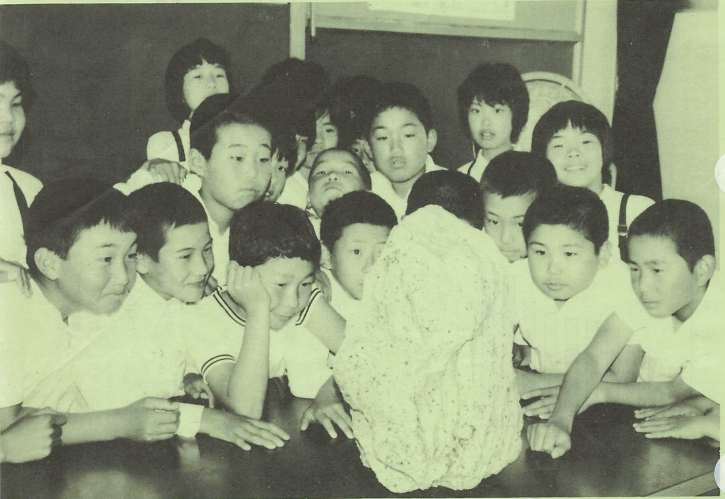
これが南極の石か