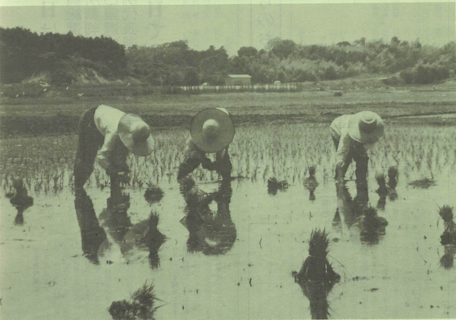
手植えは前へ前へと(岩倉地区で)