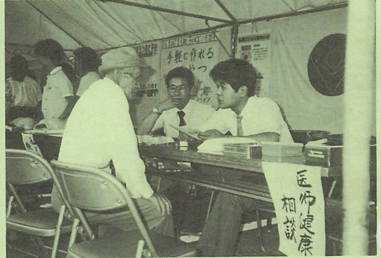
左上、試食をするお母さん方 右上、私たちが母子健康推進員です 左下、なるほどこねえな味付がいいネ 右下、どんな具合ですか、おじいちゃん