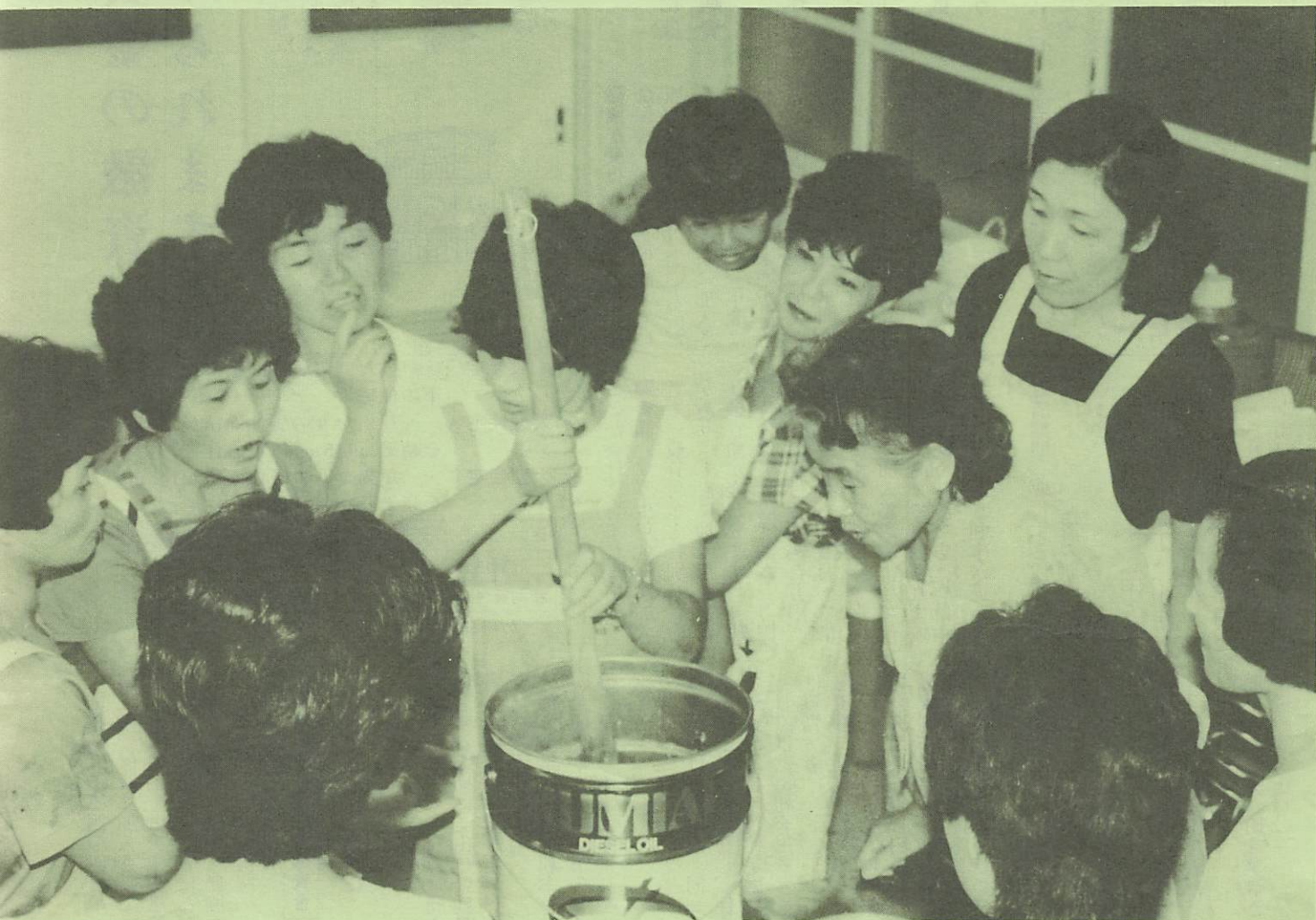
▲「思ったよりも簡単に出来るのネ」